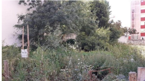
Av Capitães de Abril, lote 10