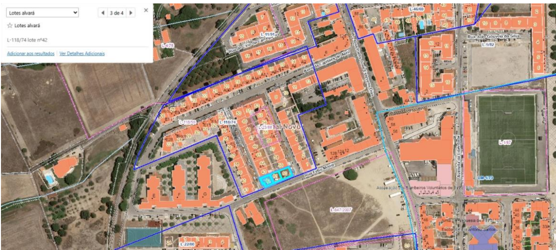
Rua Febo Moniz Lotes 42, 60 e 61