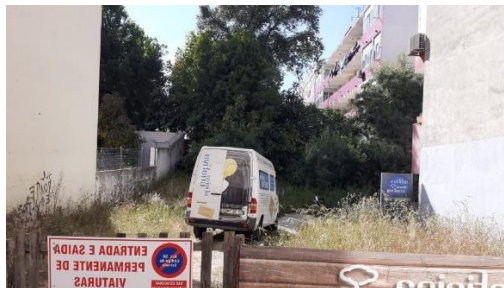
Rua Fernando Pessoa, lote 8