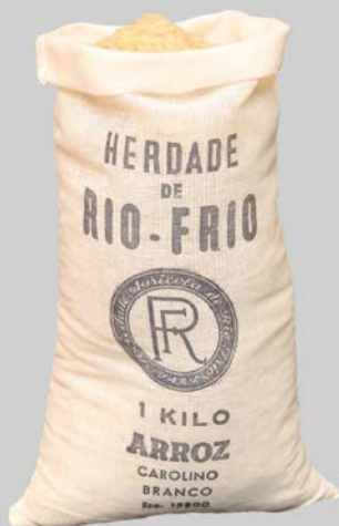
Saco de Arroz

Dois séculos e meio de história, representados por uma pequena embalagem de kilo de arroz carolino. Um saco de pano branco com o símbolo da Sociedade Agrícola da Herdade de Rio Frio e a indicação de preço, no valor de 15$000 escudos (equivalente a 0,075€), que surgem estampados a azul-escuro.