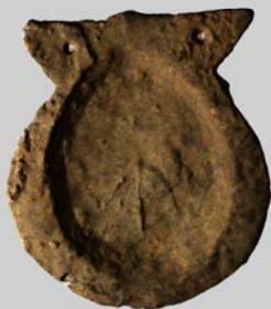
Insignia da Ordem de Santiago

A Insignia simboliza a presença da Ordem de Santiago no Castelo de Palmela, desde a segunda metade do século XII /início do século XIII. O castelo é doado aos freires-cavaleiros de Santiago (em 1186), que aqui instalam um primitivo convento-sede com funções de aquartelamento militar, num período de grande instabilidade da região e das fronteiras cristãs, no sul muçulmano. O Castelo de Palmela ( hisn Balmála ), de origem Omíada (século VIII/IX), foi residência e fortificação militar de governantes e populações muçulmanas, até à sua conquista pelas forças cristãs, uma primeira vez em 1147, e definitivamente no ano de 1194.