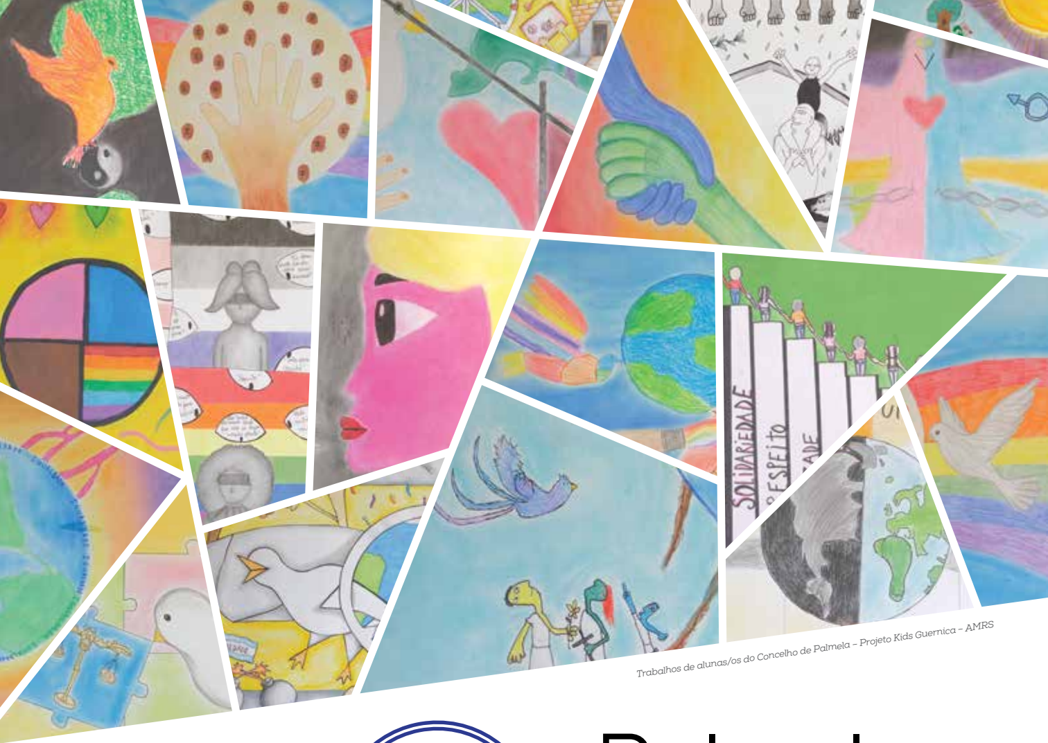
Trabalhos de alunas/os do Concelho de Palmela – Projeto Kids Guernica – AMRS