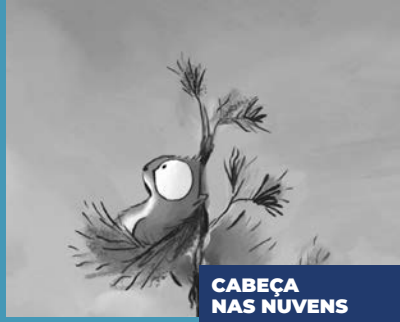
CABEÇA NAS NUVENS