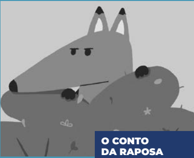
O CONTO DA RAPOSA