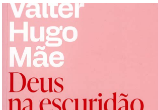
DEUS NA ESCURIDÃO Valter Hugo Mãe