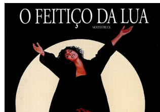
O FEITIÇO DA LUA Norman Jewison