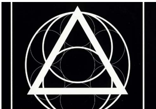
MIND AT LARGE Blasted Mechanism