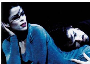
A COMPANHIA Robert Altman