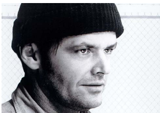
VOANDO SOBRE UM NINHO DE CUCOS Milos Forman